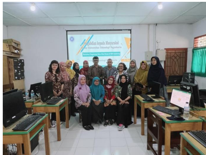
Gambar 6. Dokumentasi kegiatan pengabdian kepada masyarakat.

Dengan menggunakan Microsoft Excel, dapat dengan mudah dalam mengelola dan menganalisis data nilai siswa secara efisien.