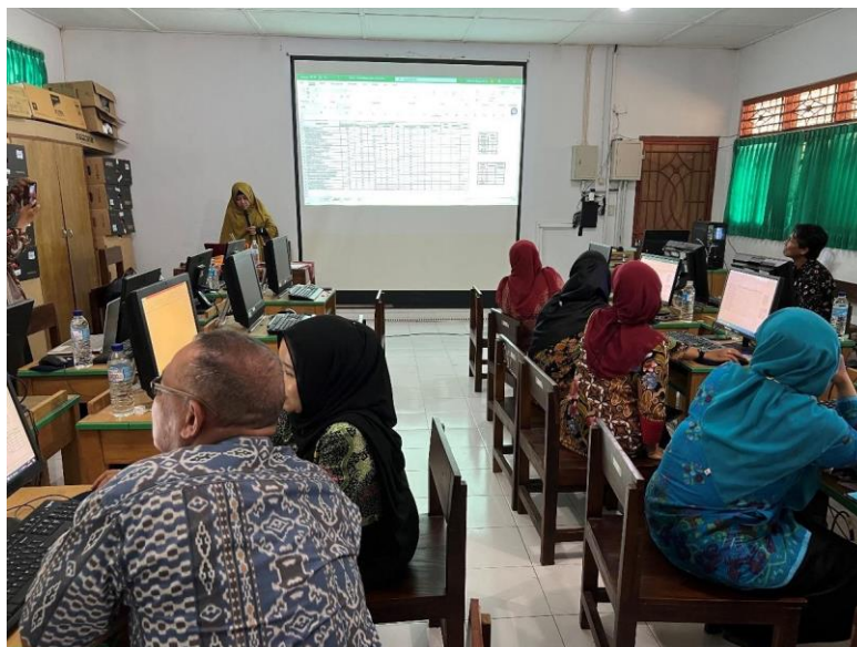
Gambar 1. Kegiatan pelatihan pengolahan data nilai siswa menggunakan Microsoft Excel .

Pada setiap akhir semester setiap guru mempunyai tugas dalam mengolah nilai akhir siswa. Pada pelatihan ini, para guru dapat memperoleh keterampilan baru dalam mengelola nilai akhir siswa. Gambar 1 memperlihatkan suasana kegiatan yang terjadi disaat pelaksanaan pelatihan Microsoft Excel .