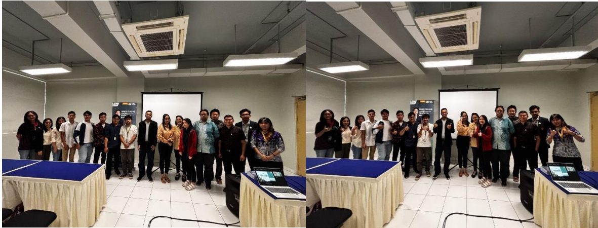
Gambar 3. Dokumentasi Para Pelaku UMKM Peserta Sosialisasi dan Pelatihan Pajak UMKM