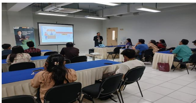
Gambar 2. Dokumentasi Kegiatan Sosialisasi dan Pelatihan Pajak UMKM